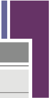
Table 2 Comparison of pruritus scores in patients before and after placebo and naltrexone therapy (mean \pm SD)